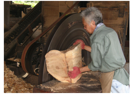
刃のついた円盤で削る