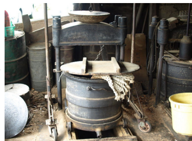
油分を絞り樟脳を分離