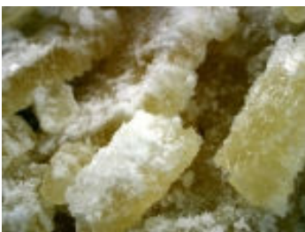
出来立てで油分を含んだ樟脳