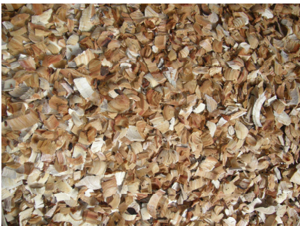
蒸気の通りやすい薄いチップに