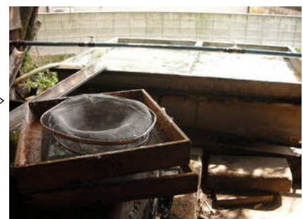
蒸留成分を冷まします