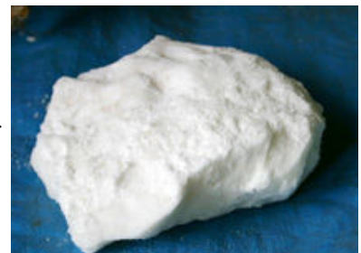
樟脳の出来上がり