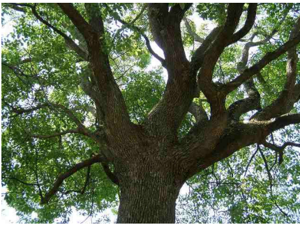
原料となるクスノキ

古くから防虫剤や医薬品に使われてきた天然樟脳（ショウノウ）。伝統的な方法で作っているのは日本で唯一、福岡県みやま市瀬高町長田にある内野樟脳だけ。アロマオイルとしてストレスや不眠対策にも人気の樟脳の