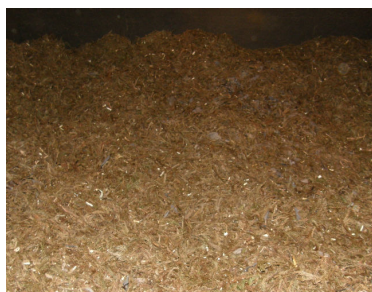
乾燥した原料(杉とタブの葉)