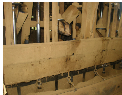
水車の力で15本ある杵を動かし「ゴットン」と砕く