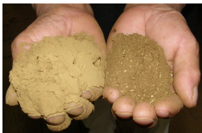
砕いた原料(右・8時間後の荒い粉) (左・それを更に23時間砕いた細かい粉)