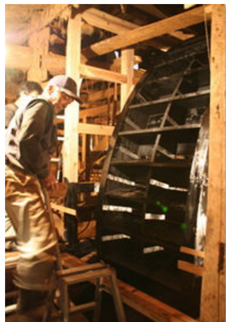
直径5mの大きな水車(八女あれこれ23より)