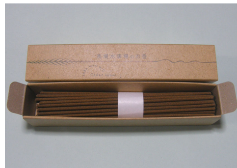
完成品:ほのかな杉の香りと自然な色合い)